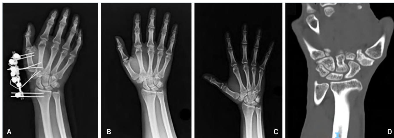
Figura 3. A. Rx a 1 mese; B. Rx a 3 mesi. C. Rx a 12 mesi. D. TC a 24 mesi post operatori.